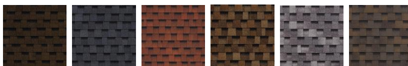
Коричневый Серый Красный Бронзовый Серебро Охра